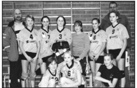
B-tytöt 2-joukkue aluemestaruuspronssia.

B-nuorissa pelattiin Idän aluemestaruusturnaukset 26–27.11. ja poikien sijoitus oli kolmas, tyttöjen 1-joukkue toinen ja 2-joukkue kolmas, eli kaikki selvittivät tiensä suoraan SM-sarjaan ilman karsintoja. Tämä oli etenkin tyttöjen osalta hieno saavutus!