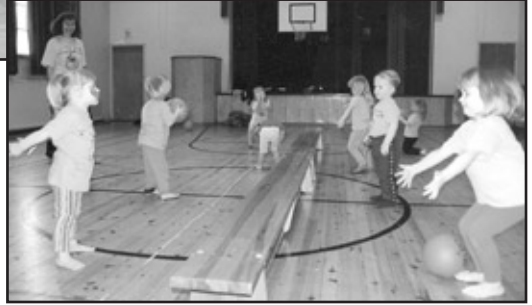
3-vuotiaat liikkarilaiset palloharjoittelussa v. 2000.

Sisällöltään liikkari on monipuolista, hauskaa toimintaa niin salissa kuin ulkona, vedessä, jäällä tai hangella. Myös yhteistunnit vanhempien kanssa ovat suosittuja ja näin toiminnasta tulee koko perheen yhteinen harrastus!