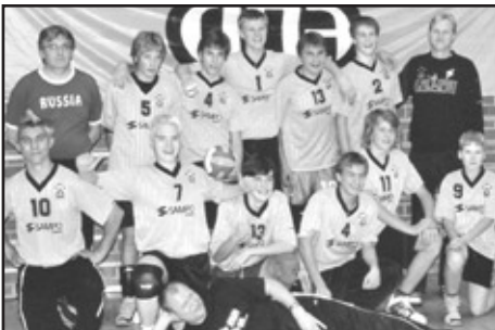
B- pojat aluemestaruus pronssia.

Miehillä on kaksi joukkuetta 4-sarjassa ja nuorempien joukkue yrittää tavoitteellisesti nousta sarjaporrasta ylemmäksi. A-nuorissa niin tytöt kuin pojatkin pelaavat SM-sarjaa ja pelien taso on jo korkeaa luokkaa. Tyttöjen tavoite on säilyä sarjan keskikastissa ja poikien otteet ovat olleet niin hurjat, että odotettavissa on pääsy SM-lopputurnaukseen.