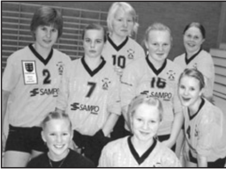
C-tytöt 1-joukkue aluemestaruuskultaa.

ruussarjaan ja muut joukkueet jatkavat tiikerisarjassa kehittymistään.