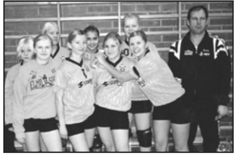
B-tytöt 1-joukkue aluemestaruushopeaa.

B-nuorissa pelattiin Idän aluemestaruusturnaukset 26–27.11. ja poikien sijoitus oli kolmas, tyttöjen 1-joukkue toinen ja 2-joukkue kolmas, eli kaikki selvittivät tiensä suoraan SM-sarjaan ilman karsintoja. Tämä oli etenkin tyttöjen osalta hieno saavutus!