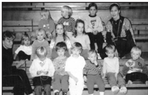
Tsempin "tiikerikoulu" v. 1993.