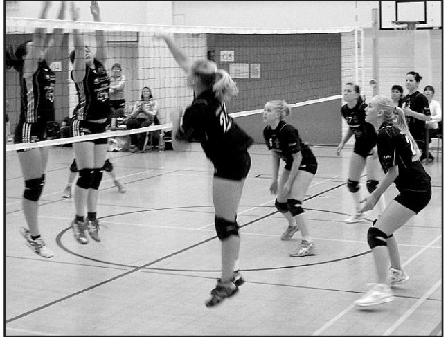
Naisten 2-sarja Vipinä Tsemppi.

Viime kesänä Tsemppiläisiä beach volleyn taitajia oli edustet-