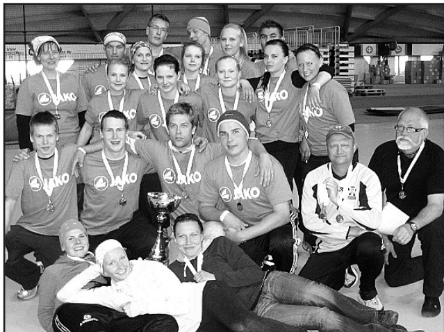
Power Cupissa Oulussa.

Naiset pelaavat edelleen 2-sarjaa ja miehet maakuntasarjaa. Yhdistetyssä joukkueessa Tsemppi-Passarit eli Team Länsi-Savo pelaa myös tsemppiläisiä. Kaiken kaikkiaan liikekannalla on n.220 tsemppiläistä pelaajaa ja valmentajaa. Heidän lisäksi joukkueenjohtajat, talkoiohmitset... joukko on suuri ja niin pitääkin olla.